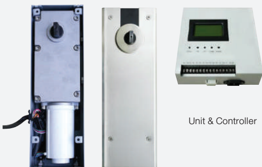
Unit & Controller